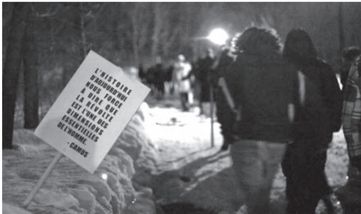
Haut: désaccord sur le pont de la Concorde. Bas: retour dans la réflexion au métro station Jean-Drapeau.