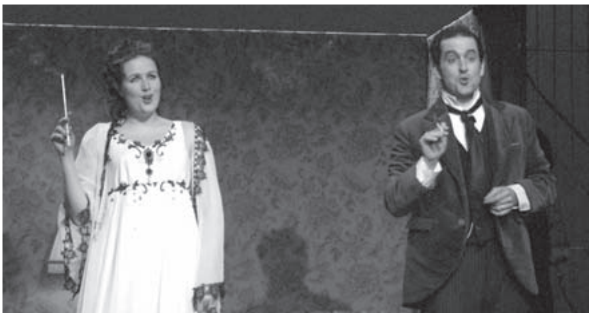
Petit malaise de l'épouse au foyer, qui ne veut pas que son mari connaisse son plaisir coupable.

L'heure espagnole, opéra-bouffe en un acte de Maurice Ravel, tient presque davantage de la comédie légère mise en musique que de l'opéra (d'ailleurs, c'est un peu ça). Sur un livret complexe, cinq chanteurs n'ont qu'un maigre orchestre (dirigé avec caractère par