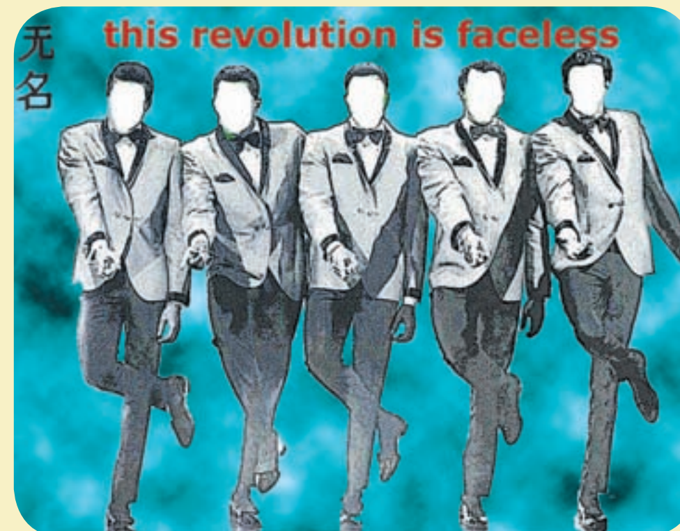
Les écrivains rassemblés sous le nom Wu Ming ont décidé de se retirer du cirque médiatique.

Les romans collectifs de Wu Ming, réputés pour la complexité de leurs intrigues, redéfinissent le conflit politique dans toutes sortes de contextes. Si 54 se situe dans la Guerre froide, Canard à l'orange mécanique envisage une révolution hyper violente contre l'oppression capitaliste de l'Oncle Picsou. Parallèlement à leurs œuvres de fiction, les auteurs de Wu Ming ont publié divers essais, notamment à propos de la liberté d'expression et de leur prise de position anti-copyright.