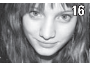
Entrevue avec Laurence Leboeuf.