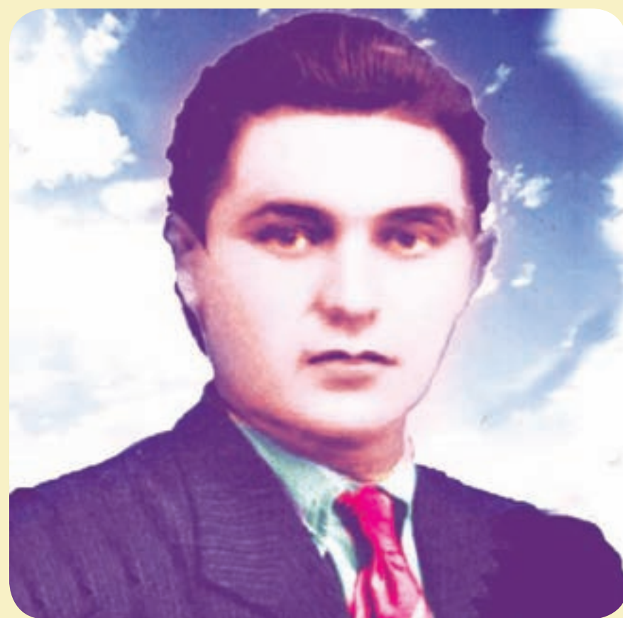
Le visage de Luther Blisset est en fait un composite de plusieurs photographies.

Un autre aspect particulier de ces manifestations, mis en évidence par la deuxième vague de soulèvements du 15 mars dernier, est une variation locale observée à partir d'un phénomène international. Ainsi, si les manifestations nord-américaines (y compris celle de Montréal, dont vous pouvez voir une photo ci-dessus) multiplient les apparitions de V, celles organisées à Perth et Sydney favorisaient le port du masque du Fantôme de l'Opéra . Au Japon, les membres d'Anonyme diffusent leurs vidéos en s'appropriant le personnage de Kira, un mystérieux tueur anonyme provenant de la série animée Death Note .