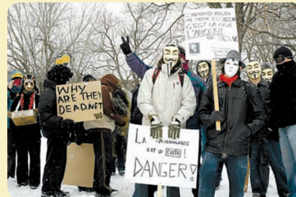
Quelques dizaines d'«Anonymes» festifs manifestaient à Montréal le 15 mars dernier.

En perpétuant les tendances espègles des groupes néoistes, Luther Blisset accomplit toutes sortes de manipulations assez complexes. En 1997, il instaure un climat de panique à Latium, en Italie centrale, en laissant de fausses représentations de messes noires et de satanisme s'infiltrer dans les médias locaux. En 1998-1999, il parvient à faire diffuser dans plusieurs magazines culturels des images de la «mort» du sculpteur serbe Darko Maver, décédé suite à un bombardement de l'OTAN. On apprend plus tard que Maver n'existait pas et que les photos (réelles) de cadavres proviennent en fait d'un site Internet ( rotten.com ). Depuis, les interventions de Blisset, y compris des performances artistiques dans le jeu vidéo Second Life , continuent sur le site 0100101110101101.org.