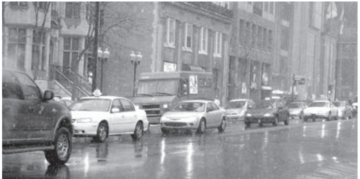
Combien de ces véhicules engorgeant la rue Sherbrooke sont conduits par des étudiants?

L'initiative de l'Université de Sherbrooke a suscité un intérêt marqué chez les étudiants de l'Université du Québec en Outaouais (UQO) et de l'Université Laval. Ces derniers n'ont cependant pas réussi à s'entendre avec leurs ad-