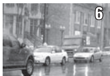
Un transport en commun gratuit?

Plus qu'un simple élément exotique sur le campus, le français est un atout pour