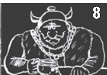
Les Vikings ou la mort.