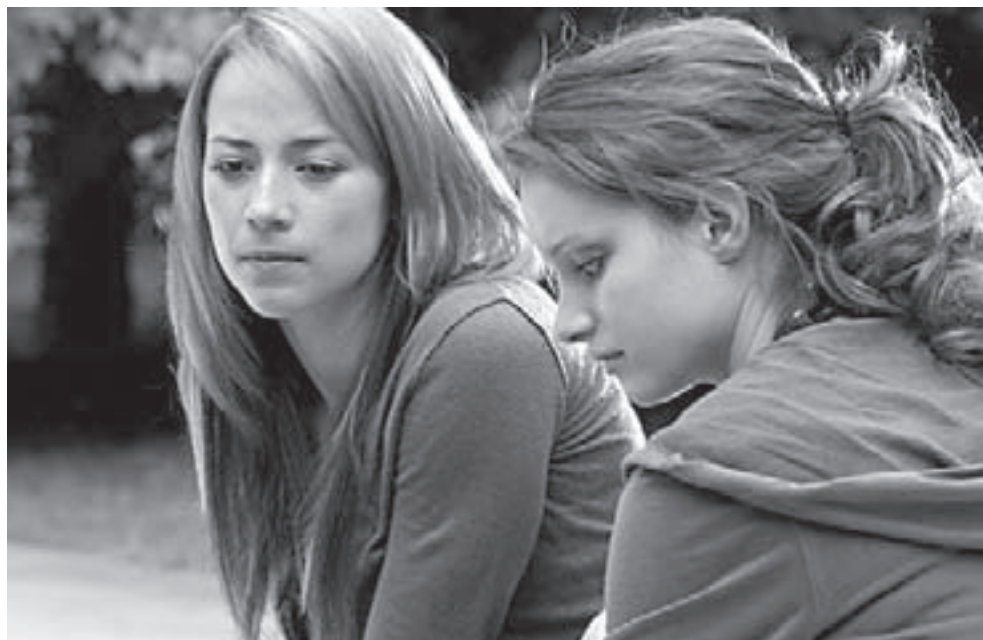
Laurence Leboeuf (à droite) dans le film Ma fille, mon ange .

L.L.: C'est la première fois que je vis ça. Et je dois avouer que je ne trouve pas cela toujours facile, pas évident. Quoi répondre? Répondre ce qu'ils veulent entendre ou ce que je pense? Il y a comme un code à respecter dans le monde artistique. Par exemple, au Gala des Jutra, j'étais bombardée de questions et je ne savais pas quoi répondre. Je n'avais même pas eu le temps de réaliser moi-même ce que j'étais en train de vivre qu'on me demandait: «Comment te sens-tu? Est-ce que tu dédies ce trophée à tes parents? Qu'est-ce que cela va changer dans ta vie?» J'étais épuisée, je voulais simplement m'en aller. Je ne savais plus quoi faire de mon corps, de ma pensée.